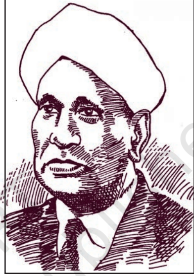
सर चंद्रशेखर वेंकट रामन्

रामन् का मस्तिष्क विज्ञान के रहस्यों को सुलझाने के लिए बचपन से ही बेचैन रहता था। अपने कॉलेज के जमाने से ही उन्होंने शोधकार्यों में दिलचस्पी लेना शुरू कर दिया था। उनका पहला शोधपत्र फिलॉसॉफिकल मैगजीन में प्रकाशित हुआ था। उनकी दिली इच्छा तो यही थी कि वे अपना सारा जीवन शोधकार्यों को ही समर्पित कर दें, मगर उन दिनों शोधकार्य को पूरे समय के कैरियर के रूप में अपनाने की कोई खास व्यवस्था नहीं थी। प्रतिभावान छात्र सरकारी नौकरी की ओर आकर्षित होते थे। रामन् भी अपने समय के अन्य सुयोग्य छात्रों की भाँति भारत सरकार के वित्त-विभाग में अफसर बन गए। उनकी तैनाती कलकत्ता* में हुई।