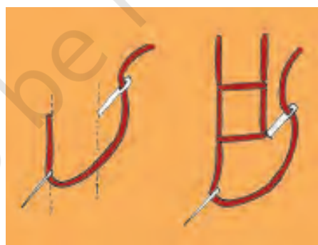
खुला हुआ ज़ंजीर टाँका